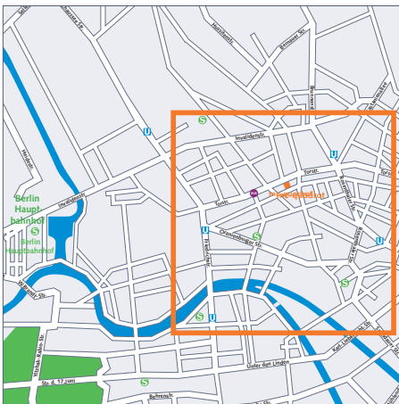
Entfernung: mc-quadrat zum Hauptbahnhof